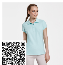
STAR WOMAN PO6634