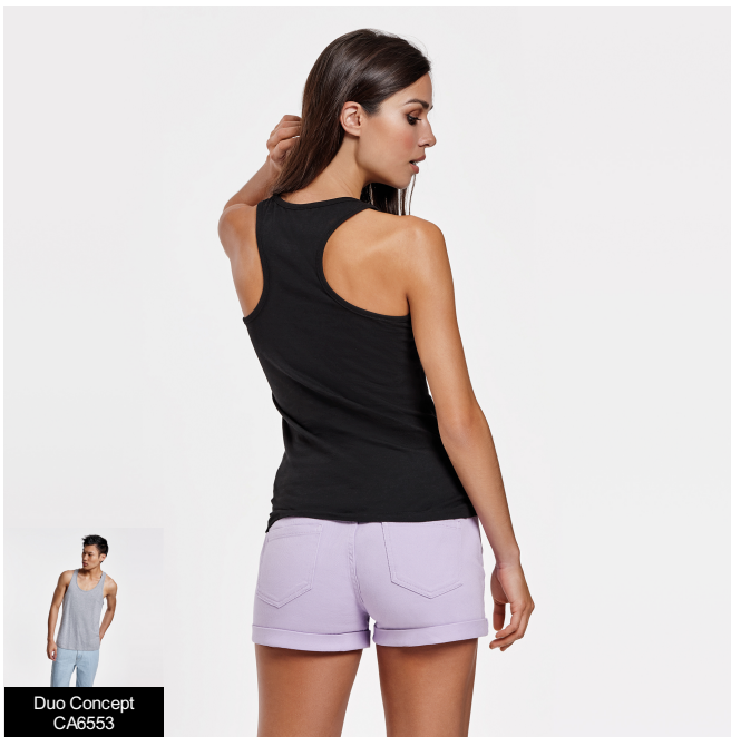
Duo Concept CA6553