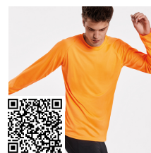
MONTECARLO L/S CA0415