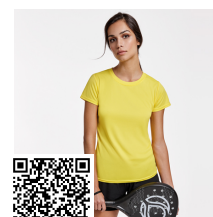
MONTECARLO WOMAN CA0423